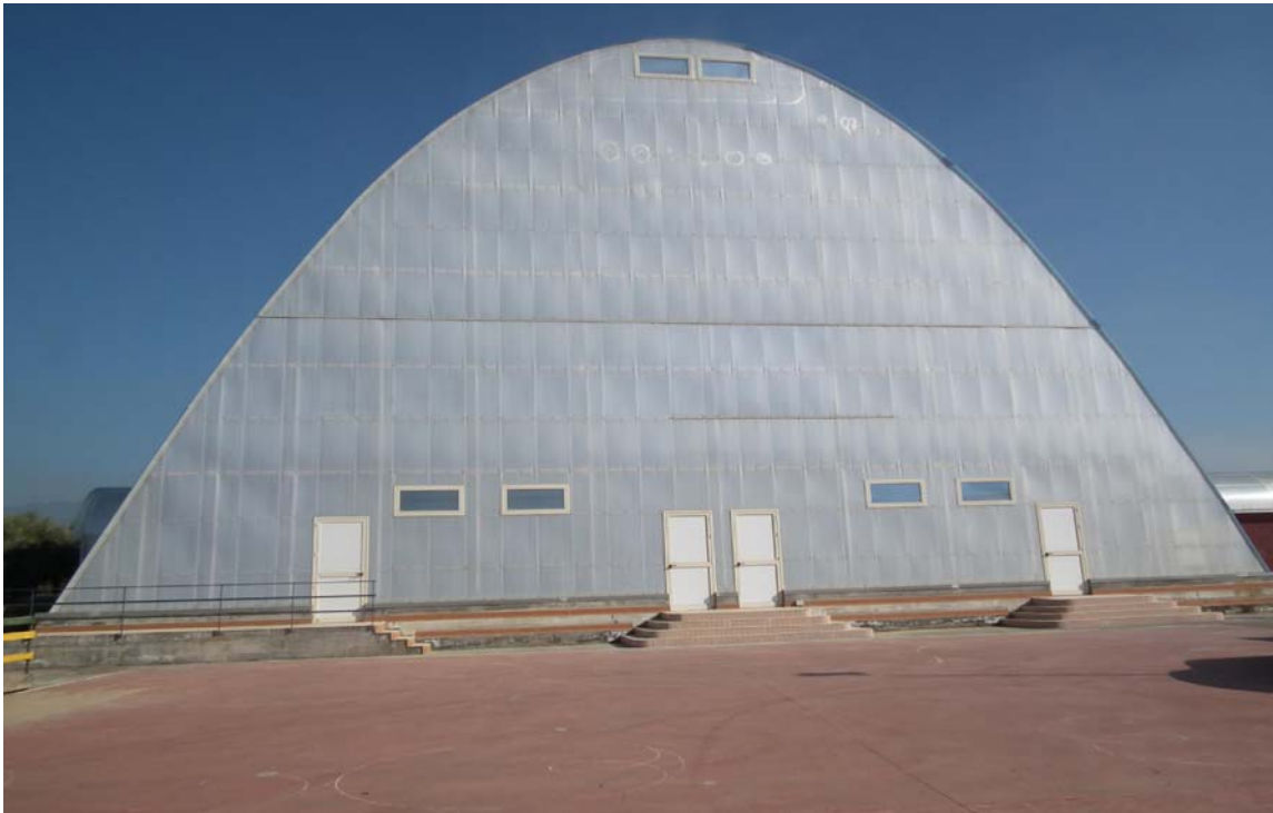
Figura 4: Veduta pista pattinaggio esterna

Per la formulazione della “proposta” offerta è consentito prendere visione dell’immobile nei giorni di lunedì, mercoledì, venerdì, dalle ore 9.00 alle ore 12.00, fino alla data del 28/04/2017, previo appuntamento da fissare telefonicamente: 095/7692109 - 3204733599.