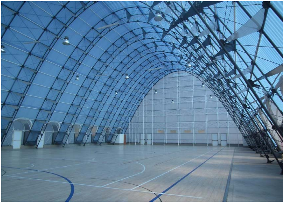
Figura 3: vista interni diurna