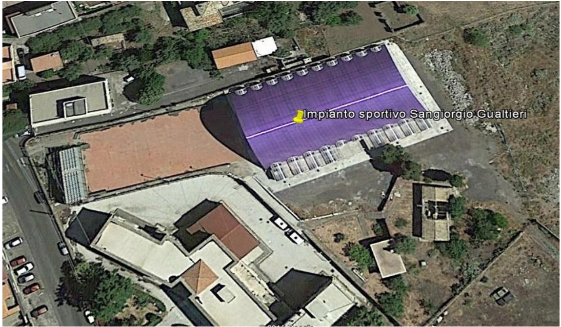
Figura 1: vista aerea