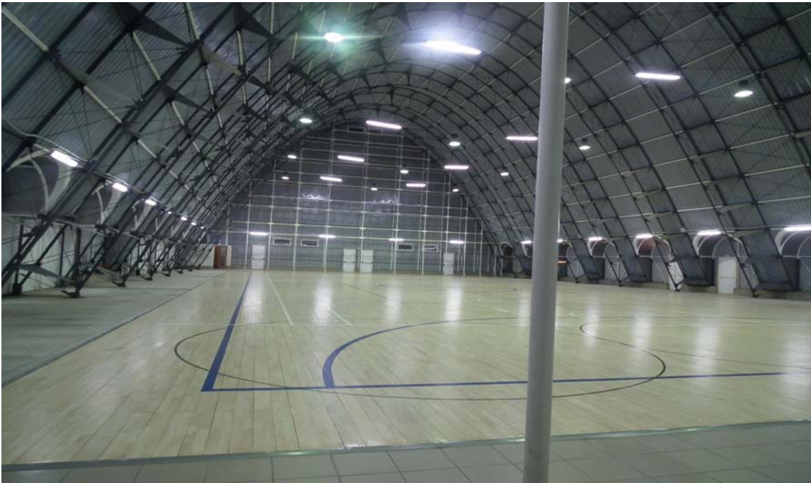
Figura 2: Vista interni notturna